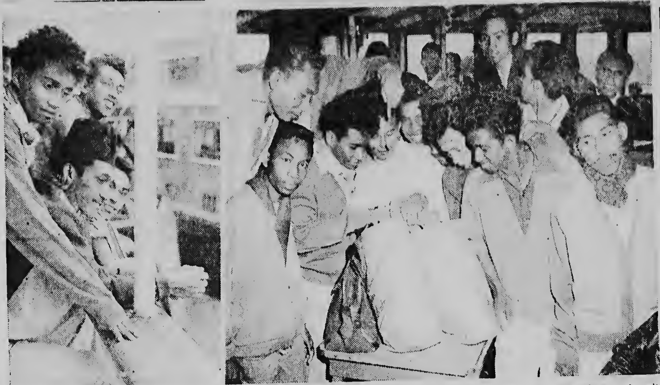
Omlangs is in Amsterdam de ontschepping begonnen van repatriërenden, die met de Johan van Oldenbarnevelt uit Indonesië waren gekomen. Aan boord bevond zich een recordaantal van plus 70 verstekelingen. Foto: de verstekelingen moesten op het achterschip wachten tot zij door de marechaussee van boord werden gehaald.